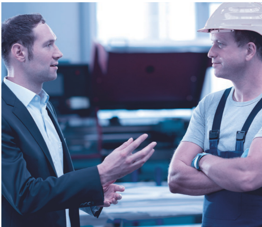
Das Mitarbeitergespräch ist keine Nebensache. Nehmen Sie sich Zeit und hören Sie zu.

Sinnvollerweise wird für das Mitarbeitergespräch zudem ein über die Jahre gleichbleibender Beurteilungsbogen mit einer Bewertungsskala (mit Smileys, Ampeln, Zahlen oder Buchstaben) verwendet.