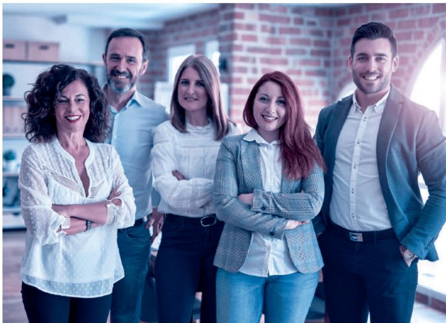
Alles klar: Das Personalreglement schafft eine verbindliche Regelung der Arbeitsbeziehung.

Grundlegender Bestandteil des Personalreglements ist das Arbeitszeitmodell des Unternehmens. Also beispielsweise die gleitende Arbeitszeit mit definierten Blockzeiten, Regelungen zum Homeoffice und die im Betrieb übliche Wochenar-