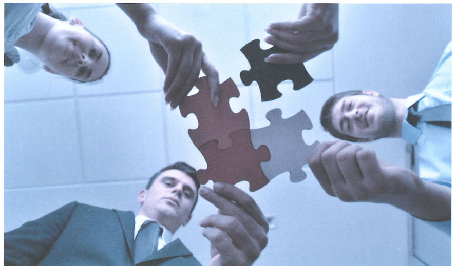
Bei gravierenden Pflichtverletzungen haften die Verwaltungsräte solidarisch. Jedes Mitglied kann für den vollen Schaden belangt werden.

«Eine sorgfältige Mandatsführung minimiert das Haftungsrisiko.»